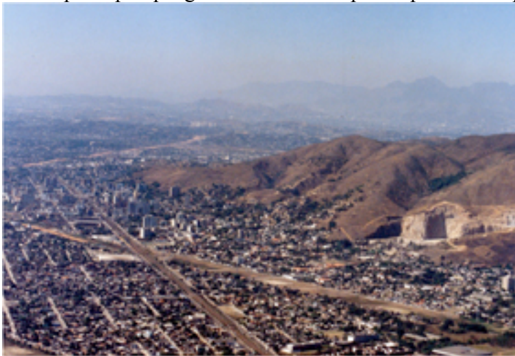
Fig 2: Visão panorâmica da cidade de Nova Iguaçu e da Serra de Madureira

Refletir sobre vegetação urbana e reflorestamento significa fundamentalmente refletir sobre a própria paisagem, compreendida como uma construção cultural que materializa as relações entre as pessoas e o local, em um processo contínuo de transformação e interpretação. Neste sentido, em termos conceituais, a paisagem foi o ponto de partida para a construção do Plano de Vegetação Urbana e Reflorestamento para Nova Iguaçu. A paisagem de Nova Iguaçu foi a matriz principal que guiou as diretrizes para o plantio e expansão da arborização (Fig. 2).