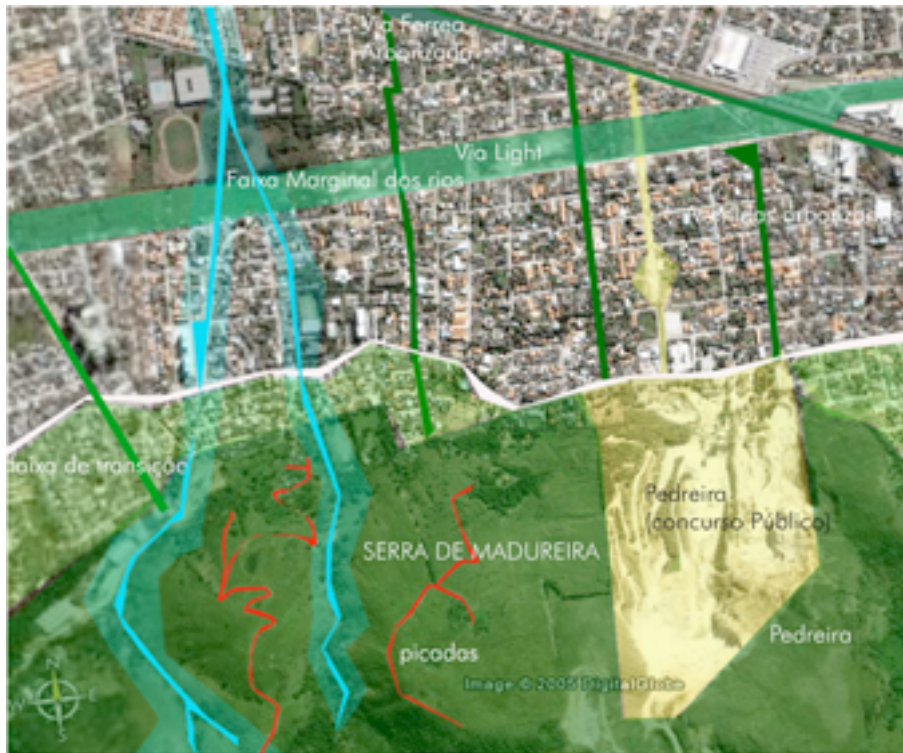
Fig. 4: expandindo água e árvores no tecido urbano

Quanto as diretrizes botânicas, a idéia é que os bairros apresentem uma pequena seleção de espécies arbóreas. Por exemplo, cada bairro ampliará suas árvores selecionando até cinco espécies para ruas e avenidas, que poderiam ser ampliadas para mais seis espécies de árvores para as outras tipologias de espaços públicos e privados. O objetivo principal da redução do vocabulário botânico arbóreo e o de buscar uma identidade paisagística para bairros, a partir de uma ênfase na estrutura ou fenologia da árvore. Além disso, a seleção das árvores seria conduzida com a participação de comunidade local, organizada pelo Programa Bairro-Escola.