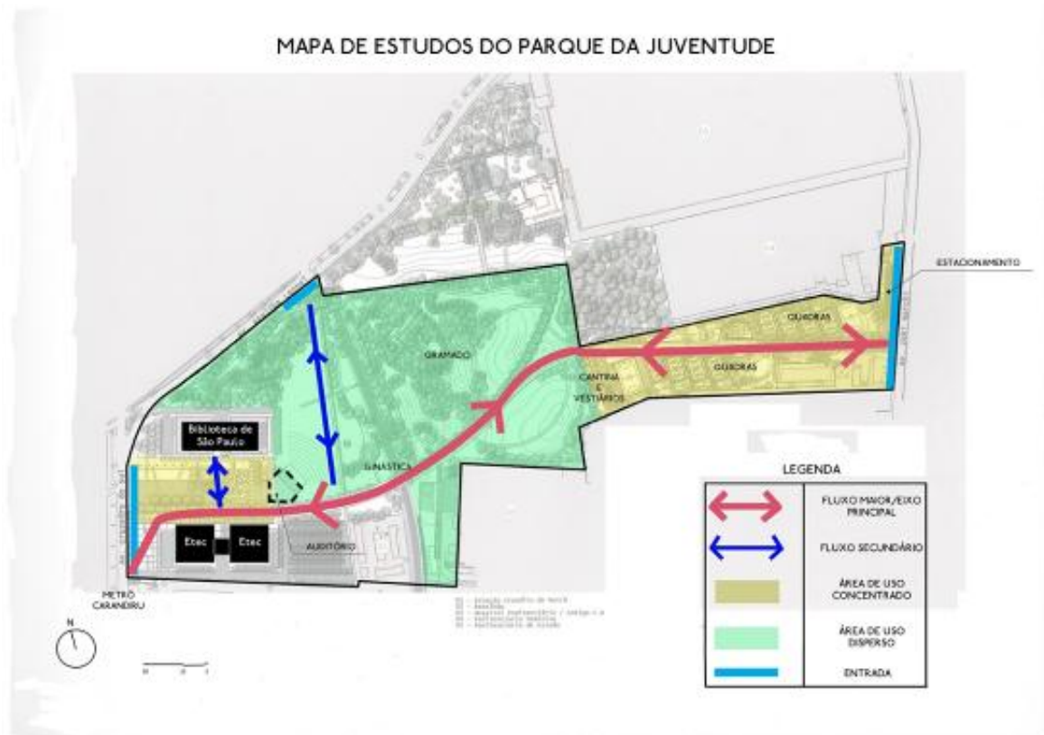
Figura 4: Mapa de Estudos do Parque da Juventude

Fonte da Base: Aflalo e Gasperini Arquitetos