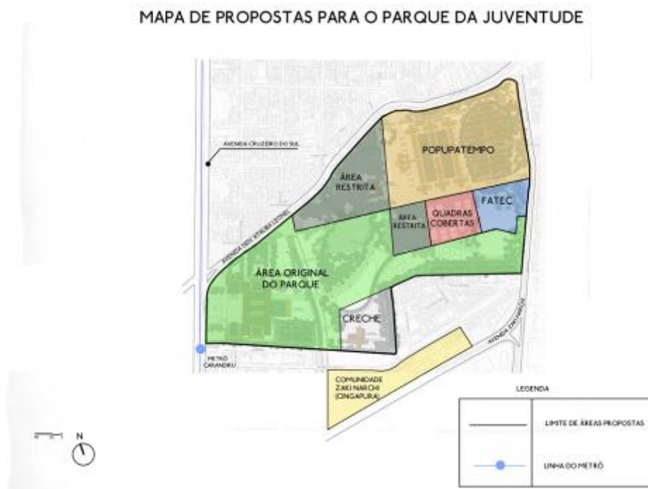
Figura 5: Mapa de Propostas para o Parque da Juventude

Primeiramente, propõe-se a instalação de uma FATEC em parte do terreno hoje ocupado pela Penitenciária Feminina da Capital. As FATECs são faculdades de tecnologia vinculadas ao Governo do Estado de São Paulo. São administradas pelo Centro Estadual de Educação Tecnológica Paula Souza (CEETEPS), mesmo órgão que administra a ETEC Parque da Juventude e a ETEC de Artes. A proposta de instalação de mais um centro educacional no terreno abarcado pelo parque seria interessante justamente devido ao fato de que já há ali equipamentos que dão suporte à educação – como a Biblioteca de São Paulo. A presença das ETECs também não pode ser desprezada. Talvez a FATEC proposta poderia oferecer cursos relacionados àqueles que são oferecidos nas ETECs, como Informática ou Logística.