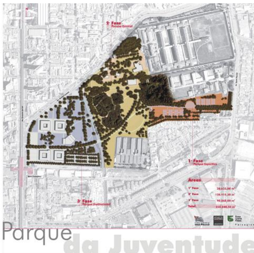
Figura 3: Projeto do parque da Juventude.