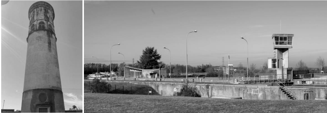
Château d'eau em Pondensac de 1917 e Ecluse em Kembs-Niffer de 1960. Le Corbusier.